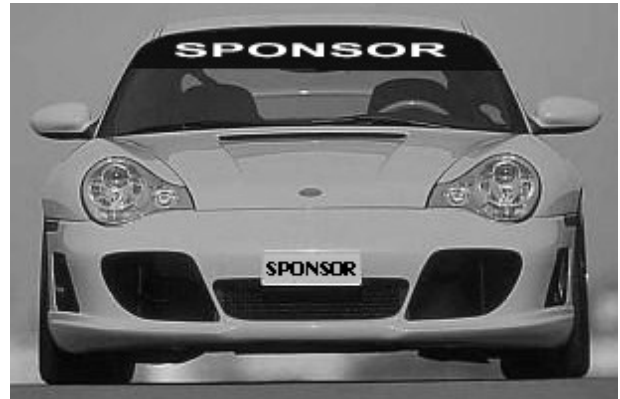
Illustration no. 2: Sunshade strip and front plate: how to apply