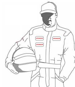
Illustration no. 3