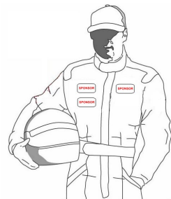
Disegno n° 3