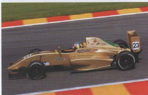
Victor Franzoni rimedia soltanto un nono posto nella trasferta belga

Gara 1: 1. Sirotkin; 2. Heche; 3. Barrabeig; 4. Sofyan; 5. Agostini; 6. Marasca; 7. Costa; 8. Visoiu; 9. Ghiotto; 10. Zonzini; 11. Spavone; 12. Orsini; 13. Roda; 14. Foglia; 15. Campese; 16. Piria. Gara 2: 1. Niederhauser; 2. Kuroda; 3. Campese; 4. Costa; 5. Barrabeig; 6. Marasca; 7. Agostini; 8. Sirotkin; 9. Franzoni; 10. Heche; 11. Spavone; 12. Zonzini; 13. Piria; 14. Orsini; 15. Ghiotto; 16. Foglia; 17. Visoiu. Assoluta Conduttori Campionato Nazionale: 1. Niederhauser p.103; 2. Heche p.97; 3. Sirotkin p.88; 4. Barrabeig p.87; 5. Costa p.67; 6. Visoiu p.50; 7. Agostini p.50; 8. Campese p.39; 9. De Beer p.36; 10. Marasca p.33. Assoluta Conduttori Trofeo Nazionale: 1. Kuroda p.112. Assoluta Conduttori Campionato Europeo: 1. Sirotkin p.73; 2. Barrabeig p.53; 3. Niederhauser p.49; 4. Heche p.39.